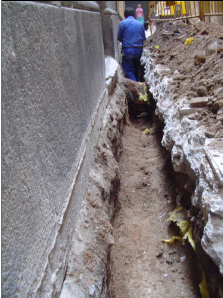
Foto 1: Treballs constructius al carrer de Sant Antoni dels Sombrerers.