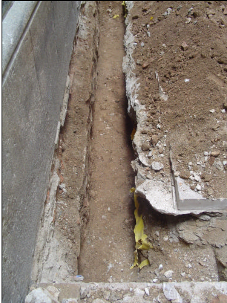
Foto 2: Detall de la rasa a la cantonada del carrer de Sant Antoni dels Sombrerers.