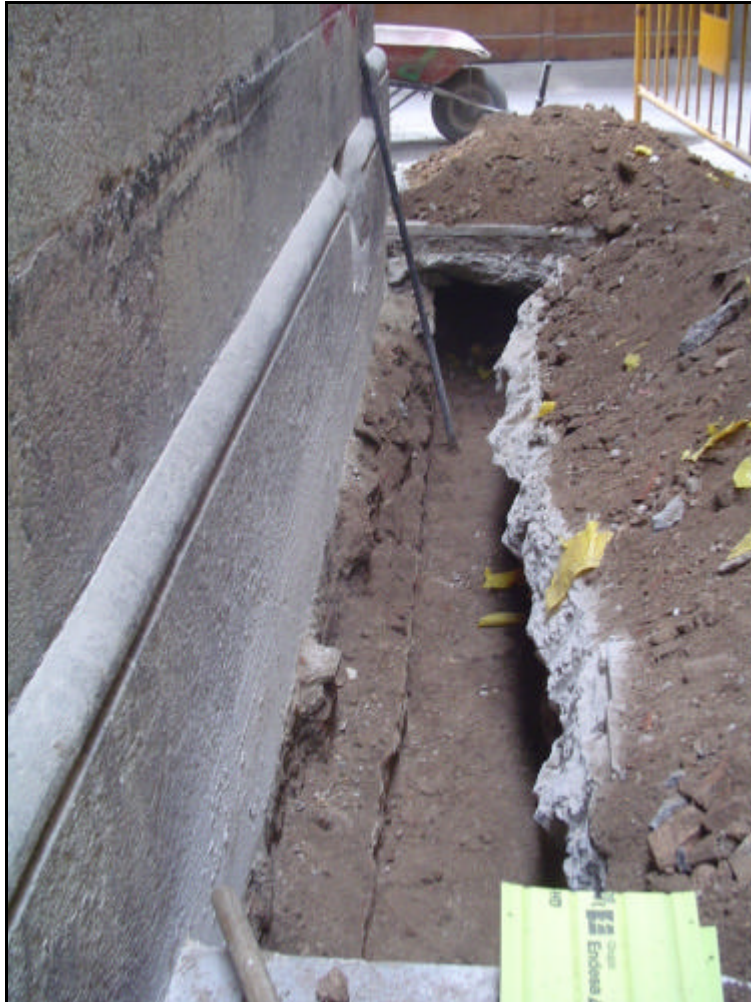
Foto 3: Detall de la rasa entre el carrer de Sant Antoni dels Sombrerers i el carrer dels Sombrerers.