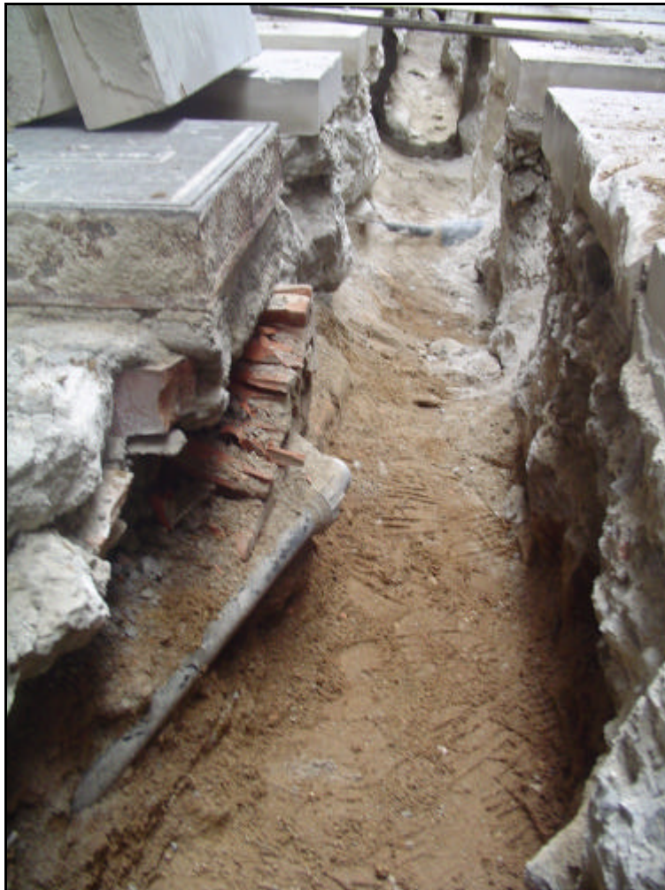
Foto 6: Detall de la quantitat de serveis a la cruïlla de la Placeta de Montcada amb el passeig del Born.