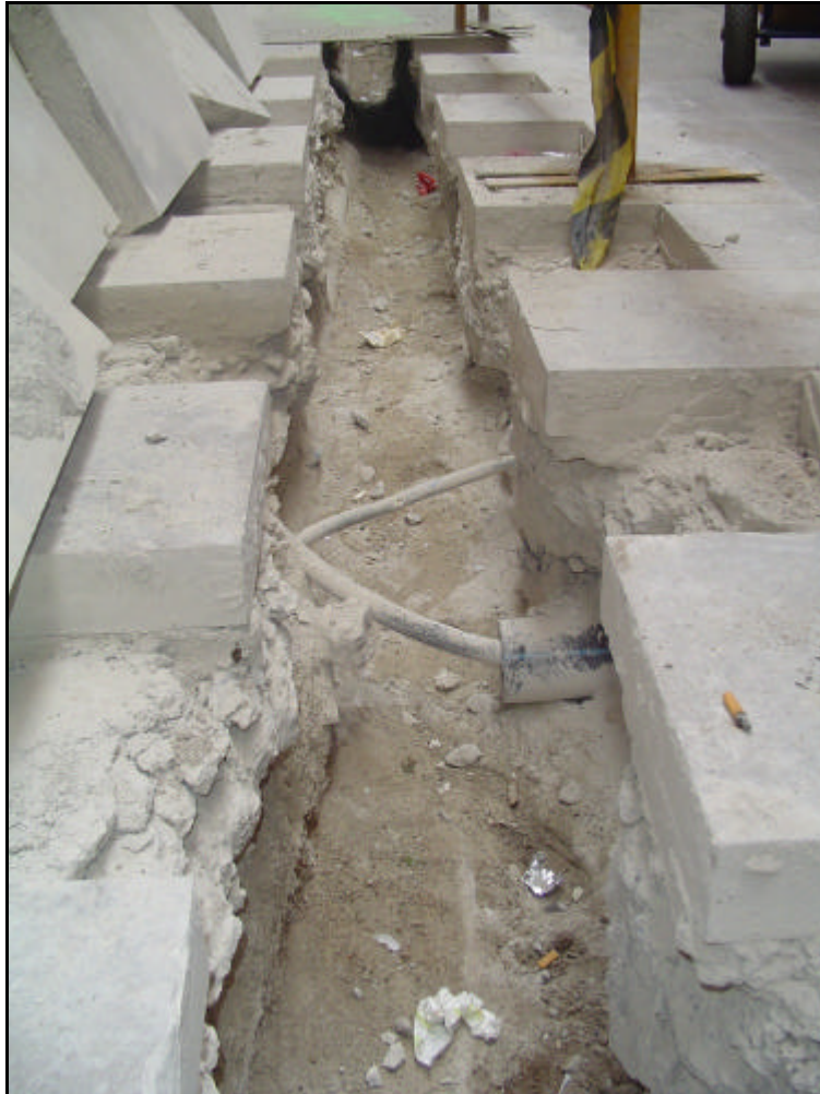
Foto 5: Imatge de detall de la profunditat de la rasa a la Placeta de Montcada.